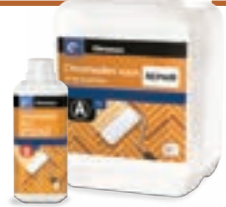
CHROMODEN AQUA РОЗЧИН ДЛЯ ЗАПОВНЕННЯ F 22